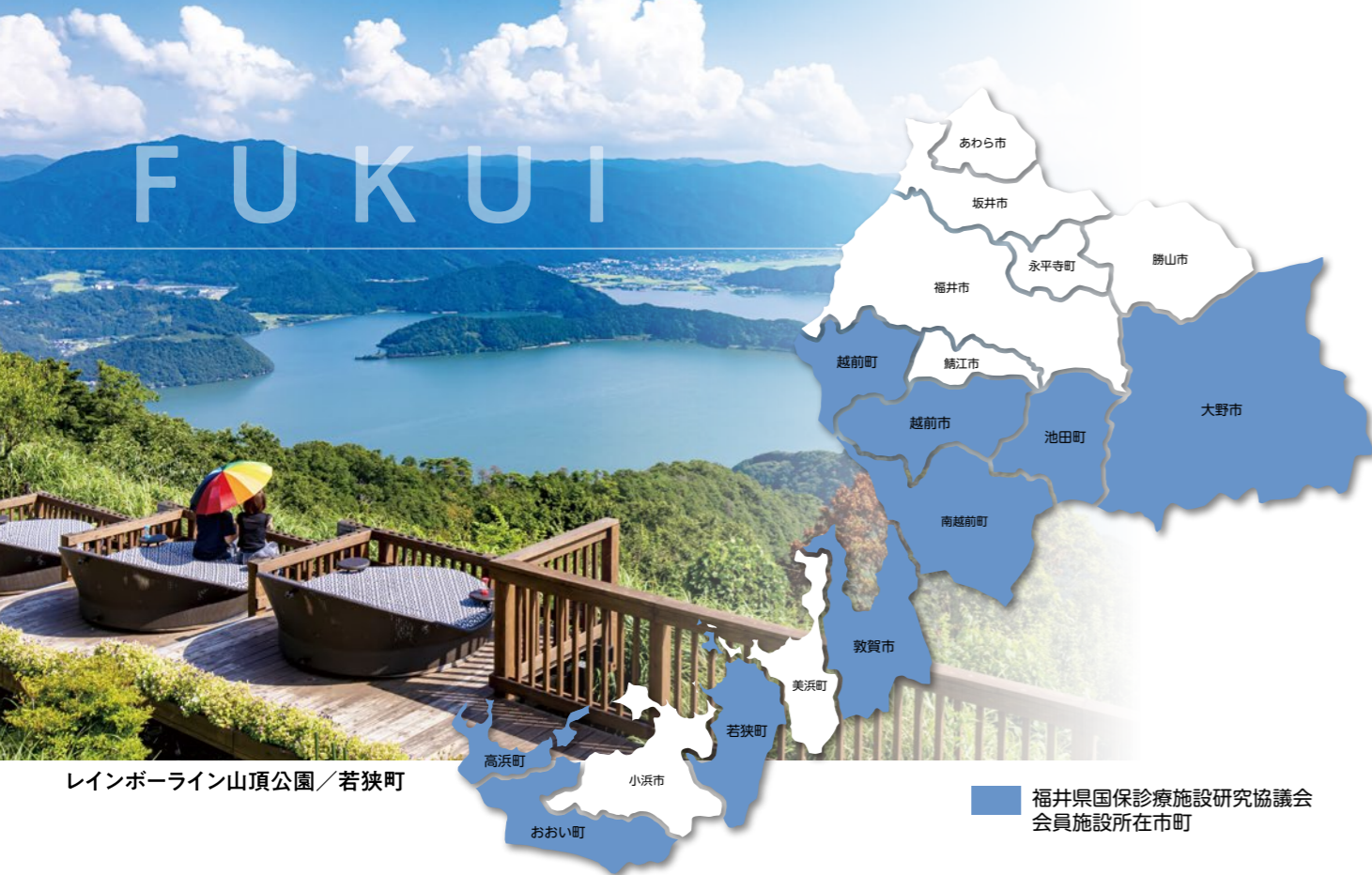
レインボーライン山頂公園／若狭町