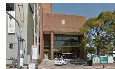
長崎新聞文化ホール