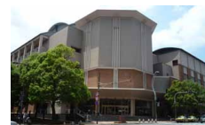
長崎ブリックホール