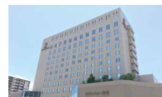
ホテルニュー長崎