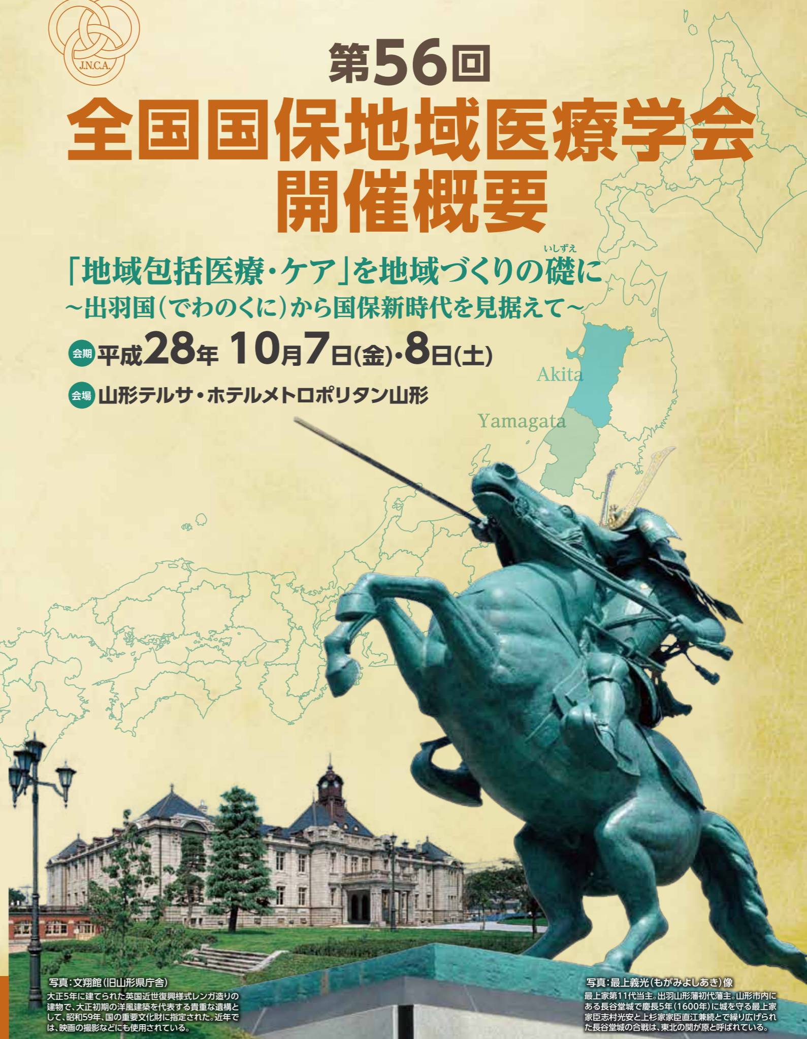
写真:文翔館(旧山形県庁舎) 大正5年に建てられた英国近世復興様式レンガ造りの建物で、大正初期の洋風建築を代表する貴重な遺構として、昭和59年、国の重要文化財に指定された。近年では、映画の撮影などにも使用されている。