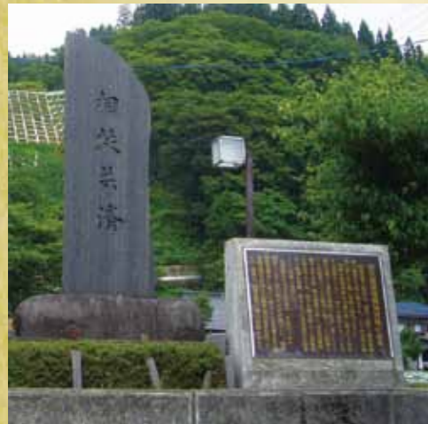
相扶共済の石碑 (山形県戸沢村)