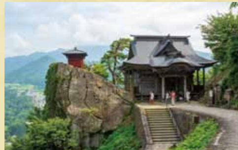
山寺 五大堂 (山形県山形市)

角川村(現 戸沢村)保険組合は、昭和11年4月に発足し、昭和13年7月国民健康保険組合に改め、同年8月1日、法律に基づく「角川村国民健康保険組合」として全国第1号の設立認可を受けたことから、埼玉県越谷市とともに国保発祥の地と言われている。